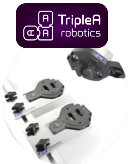
電気、エア不要の自動 ツールチェンジャー