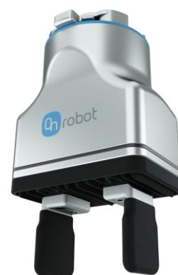
クリーンルーム対応、IP67認定 の平行グリッパー

※ロボット教示等を行う作業者には、安全衛生特別教育（教示）の修了が必要となります。