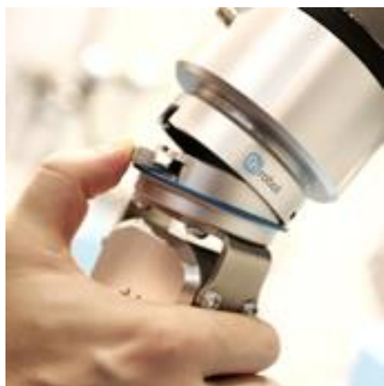
ワンタッチで他のハンドに付け替え